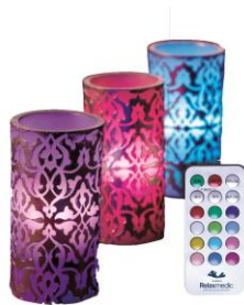
VELA LUXOR LED RM-VL0007