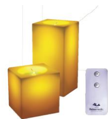
VELA SQUARED LED RM-VL0007