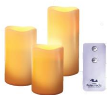
TRIO VELA LED RM-VL0007