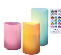
VELA MULTI COLOR LED RM-VL0007